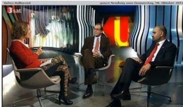
Was sind die Ideale geblieben? Kulturzeit online: Tempo Bildung: Was läuft falsch im einstigen Land der Dichter und Denker? Welche Bildung brauchen wir und welche Wertmaßstäbe? Hat das Humboldtsche Bildungsideal heute noch Gültigkeit?