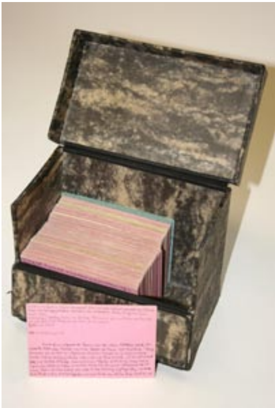
Die Lichtenberg-Kartei (Universitätsbibliothek Gießen, Sammlung Walter Benjamin).

über andere Lichtenberg-Werke, auch zeitgenössische. Der Verwendungszweck der gelben Karten ist unklar. Im hinteren Teil der Kartei finden sich auf weißen und hellgraublauen Karten Grundsätze für die Erarbeitung und Anlage der Bibliographie. Auf zwei grünen Karten werden fremdsprachige Ausgaben Lichtenbergs verzeichnet. Am Ende stehen auf einer hellblaugrauen Karte ein Antiquariatskatalog und auf mittelblauen Karten literarische Anthologien, in die Texte von Lichtenberg aufgenommen worden sind. Bemerkenswert sind noch im hinteren Teil ein Block verschiedenfarbiger Karten als Konzept- und Merktzettel Benjamins, vor allem mit Listen von durchzusehenden Zeitschriften und Büchern. Darunter befindet sich als einzige Nicht-Karteikarte ein Blanko-Leihschein der Preußischen Staatsbibliothek