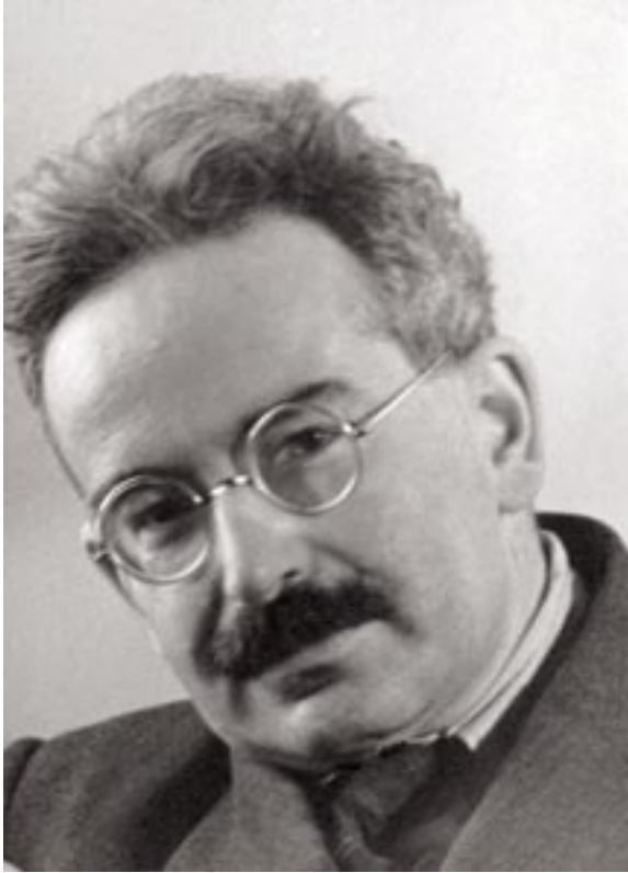
Walter Benjamin, wahrscheinlich in den späten 30er Jahren (Universitätsbibliothek Gießen, Sammlung Walter Benjamin).

komplizierten Geschichte des Benjaminschen Nachlasses nicht verwundern kann. Trotz dieser Einschränkungen ist allein schon der Umfang der Gießener Sammlung bemerkenswert. In dieser Hinsicht steht sie nur hinter den (allerdings weitaus umfangreicheren) Sammlungen in Berlin (Walter Benjamin Archiv an der Akademie der Künste, wo sich die sogenannten Berliner, Frankfurter und Pariser Nachlass-teile befinden) und Jerusalem (Jewish National and University Library, Sammlung Gershom Scholem) und neben dem immer noch im Moskauer „Sonderarchiv“ befindlichen Nachlasssplitter. Dennoch ist die Gießener Sammlung als solche nie in ihrer Gesamtheit und Bedeutung wahrgenommen worden – was aber nicht bedeutet, dass sie der Forschung gänzlich unbekannt gewesen ist.