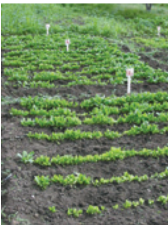
Feldversuch auf schwermetallbelastetem Boden in Georgien