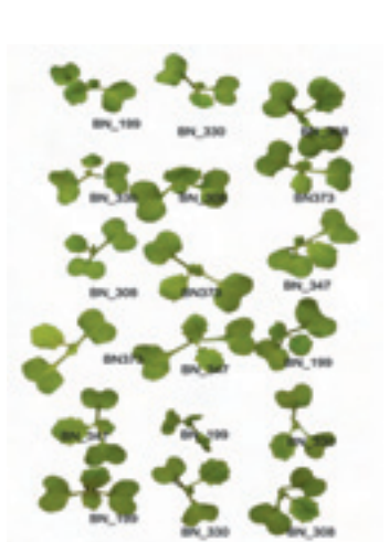
Umfangreiche Phänotypisierung ist eine der Säulen des ASSYST-Verbundvorhabens