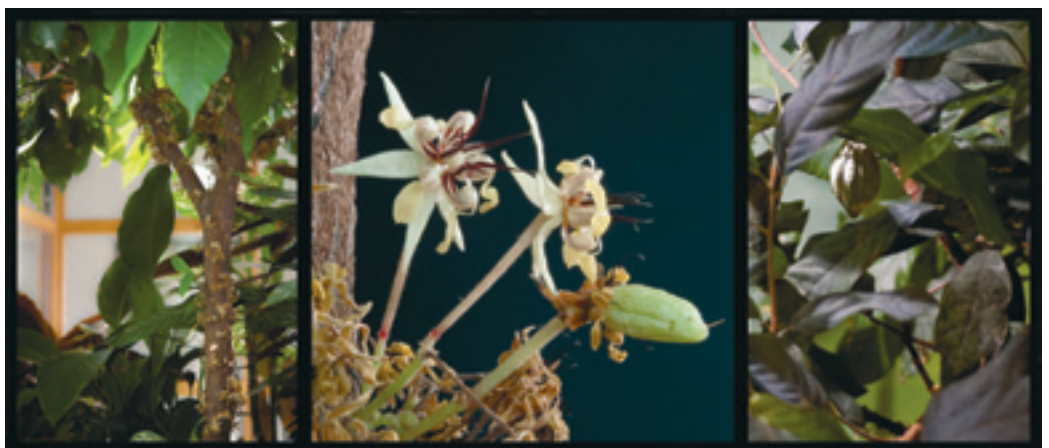
Kakao-Blüten (links, Mitte) und eine junge Kakao-Frucht am Stamm einer Kakao-Pflanze im IFZ