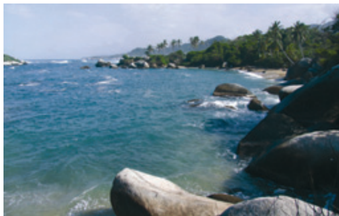
Der Tyrone Nationalpark in der Nähe von Santa Marta - eines der Hauptuntersuchungsgebiete des neuen Exzellenzzentrums

Exzellenzzentren sind Kooperationen in Forschung und Lehre zwischen deutschen Hochschulen und ausländischen Partnerinstituten. Sie haben das Ziel, exzellente ausländische Wissenschaftler und ausländische Spitzenforschung mit der deutschen Forschung zu vernetzen. Deutsche Forschung und Lehre soll Impulse aus dem Ausland erhalten und das globale Netzwerk der Spitzenforschung