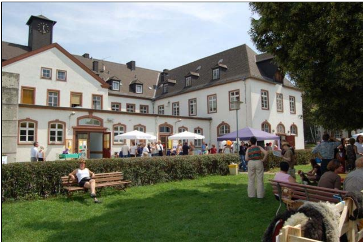
„Es wird gefeiert...“