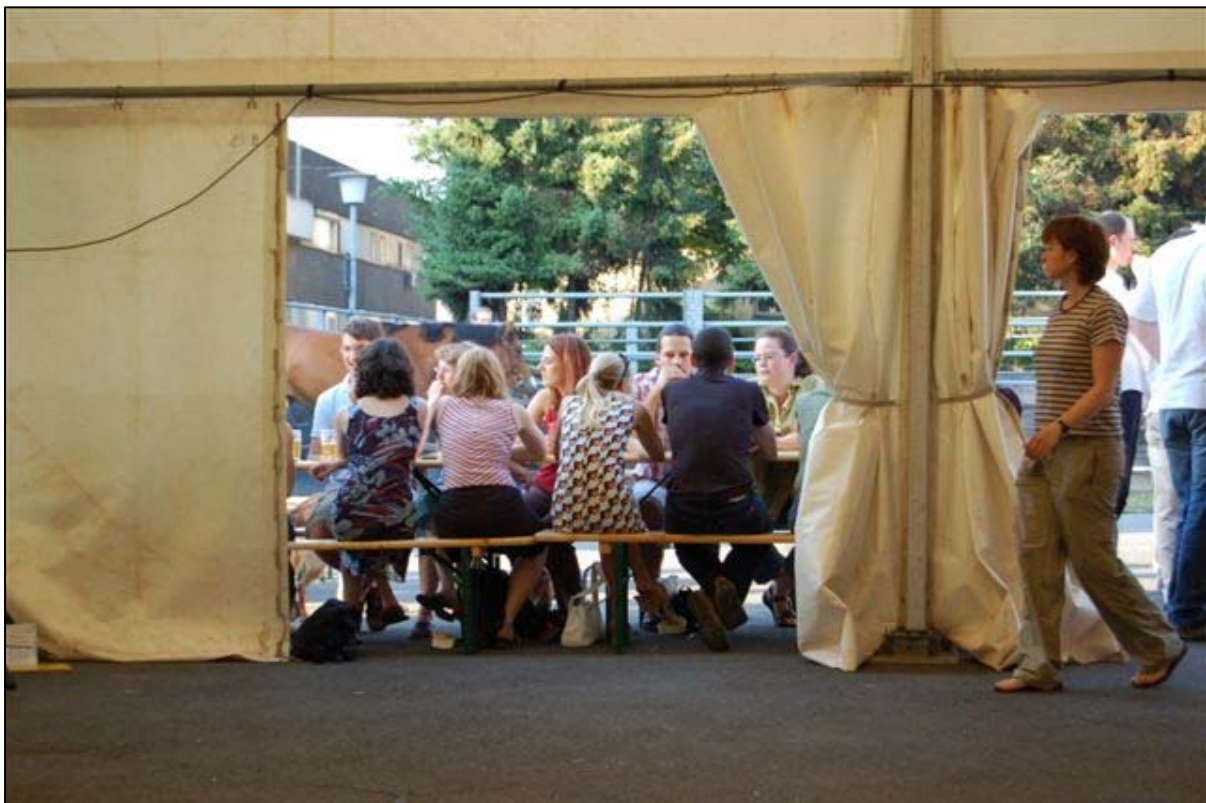
Festzeltstimmung, auch außerhalb