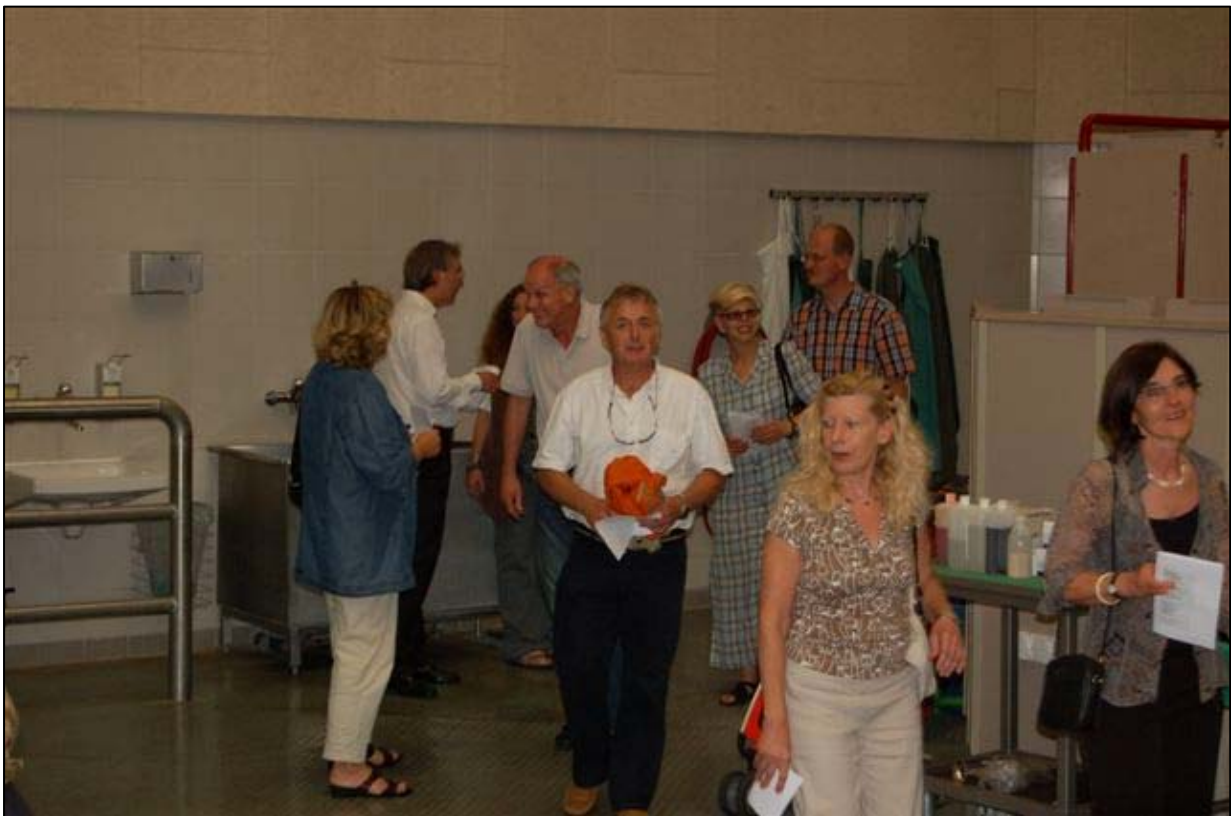
„Mein Gott, hat sich das hier verändert...“; Gäste in der KGGGA