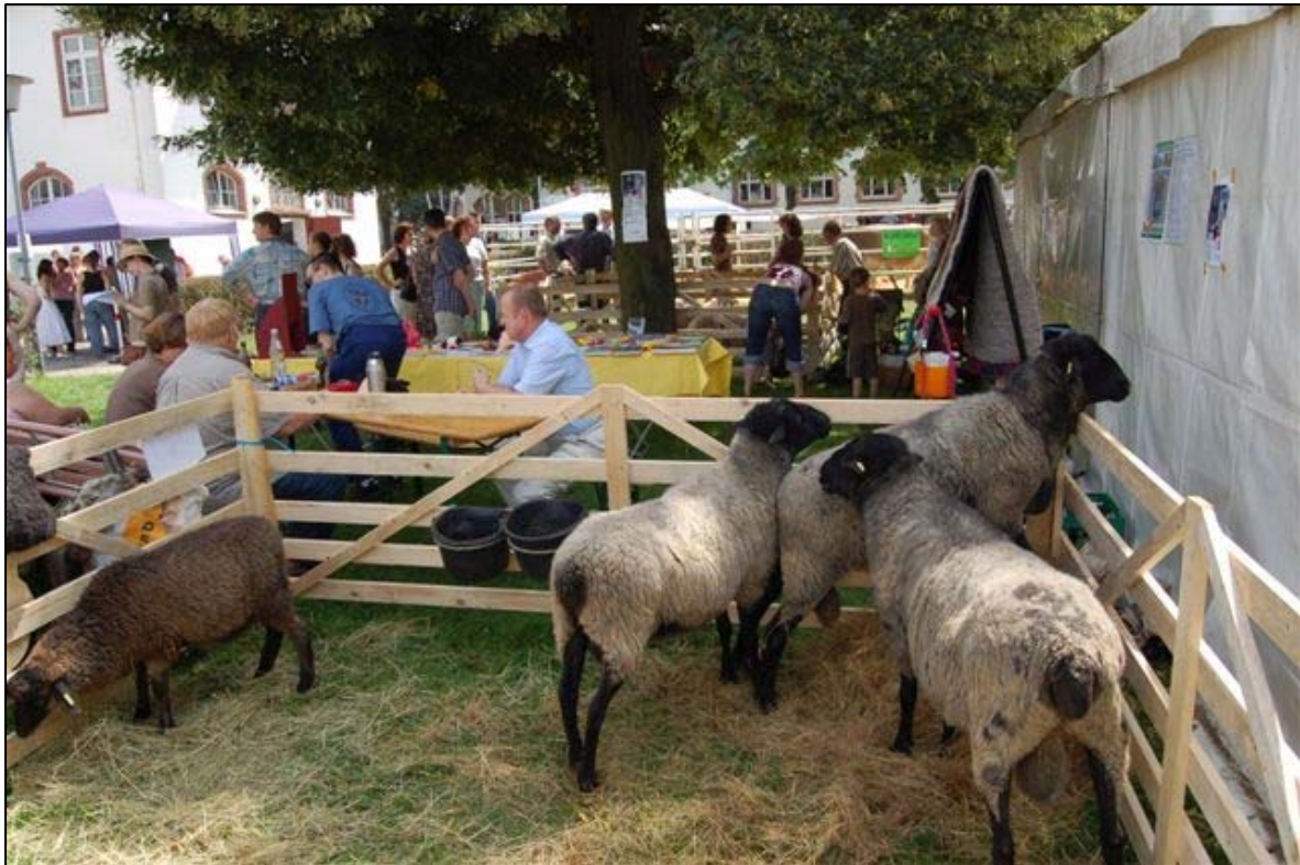
Die GEH stellte bedrohte Tierarten aus