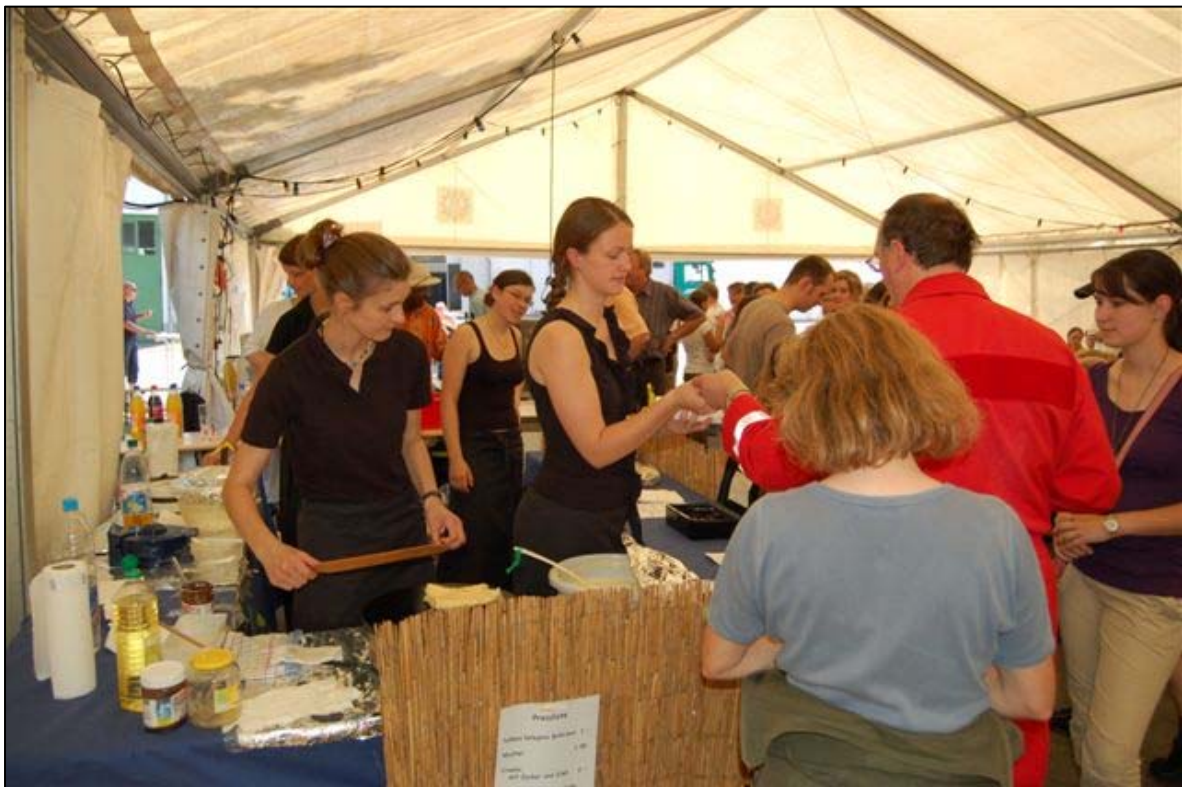
Die Studierenden trugen mit Selbstgebackenem zur Beköstigung bei