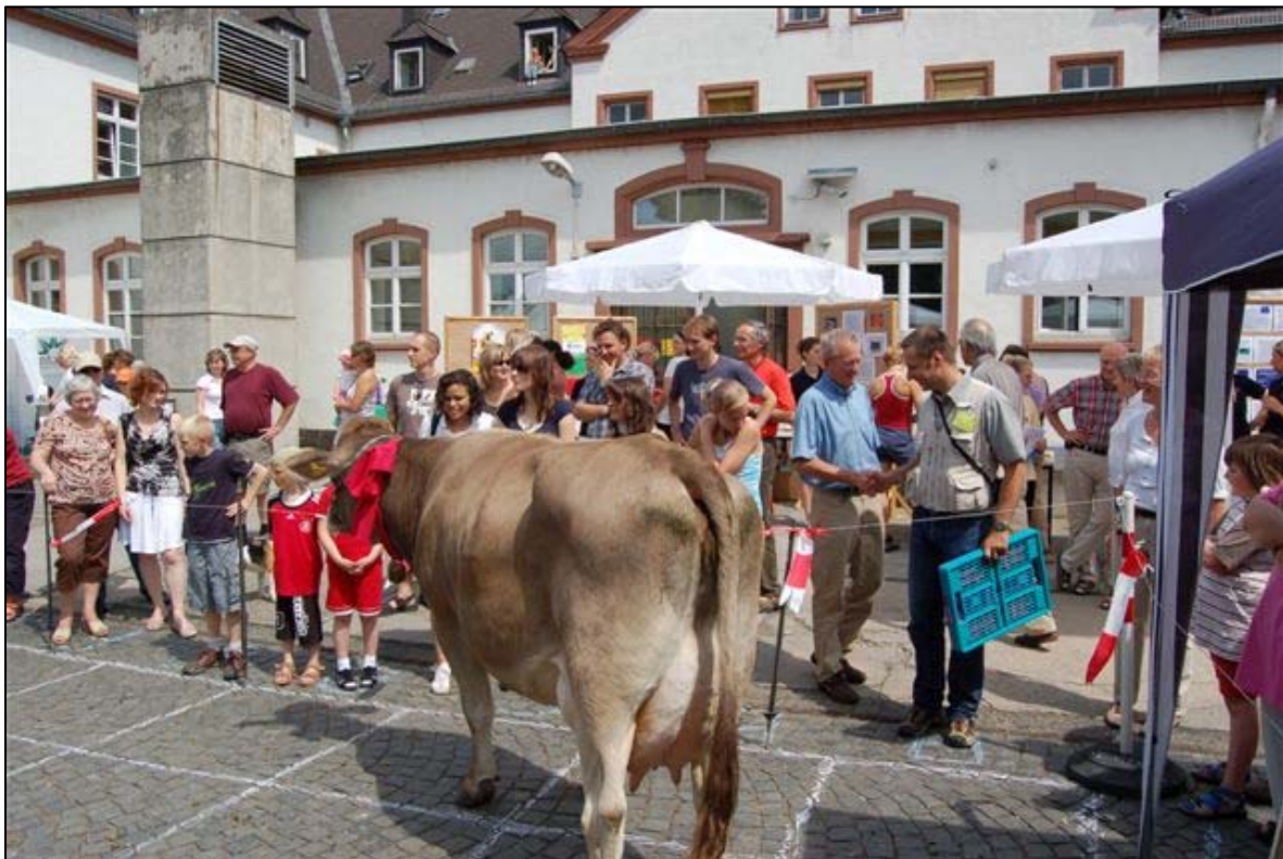
„Kuhfladen-Roulette“ mit hohem Einsatz